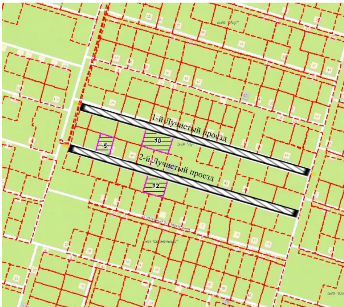
Схема расположения элементов планировочной структуры в Гагаринском административном районе

Приложение к постановлению администрации муниципального образования «Город Саратов» от 24 октября 2023 года № 4891