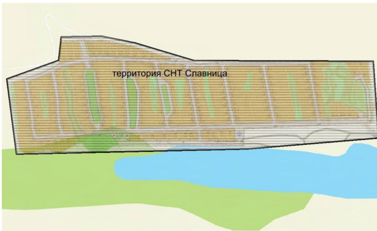
Схема расположения элементов планировочной структуры в Гагаринском административном районе

Приложение № 3 к постановлению администрации муниципального образования «Город Саратов» от 24 октября 2023 года № 4890